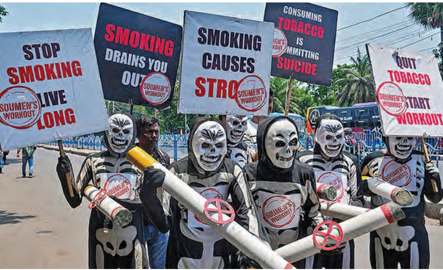
అధికారుల కోరికతో పాగా వ్యతిరేక దినం సందర్భంగా రా్యలీలో పాల్గొన్న ప్రజలు

>>> తెలిపారు. సకాంతలో సాగునీటిని విడుదల చేయడంతో పాటు రైతు పండించిన పంటను కొనుగోలు చేస్తున్నామని అన్నారు. ఎంపీ ఎమ్మెల్యేలు మాట్లాడుతూ గత ప్రభుత్వంలా కాకుండా కూటమి ప్రభుత్వంలో సాగునీటి ప్రాజెక్టుల నిర్వహణకు, రైతులకు వినియోగిచ్చే పెట్టడి చేస్తూ నిధులు విడుదల చేస్తున్న ప్రభుత్వంపై చంద్రబాబుకు ప్రత్యక్షతలు తెలియజేశారు. ఈకార్యక్రమంలో ఇరిగేషన్ అధికారులు క్రొజెక్ట్ కమిటీ సభ్యులు పాల్గొన్నారు.