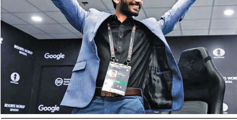
నార్వే చెస్ టైటిల్ రేసులో గుకేష్; ప్రజ్ఞానందపై విక్టరీ

ఓస్లో: భారత గ్రాండ్ మాస్టర్, ప్రపంచ ఛాంపియన్ గుకేష్.. నార్వే చెస్ టైటిల్ రేసులో నిలిచాడు. 20వ పుట్టినరోజు ముగిసిన మరుసటి రోజే అద్భుతంగా పుంజుకుని భారత్ కే చెందిన ప్రజ్ఞానందపై కీలక విజయం సాధించాడు. ఓస్లో జరిగిన ఈ ఉత్సాహభరిత ఛాంపియన్ షిప్ గుకేష్ చివర క్షణాల్లో అద్భుత సంయమనంతో ప్రత్యర్థిని మట్టికరిపించి మూడు పూర్తి పాయింట్లు సొంతం చేసుకున్నాడు. ఇప్పటివరకు ఆశించిన ఫలితాలు రాక కొంత నిరాశతో కనిపించిన గుకేష్.. ఈ విజయంతో మళ్లీ చిరునవ్వు చిందించాడు. ప్రస్తుతం 6.5 పాయింట్లతో మూడో స్థానంలో నిలిచిన గుకేష్.. టోర్నీలో మిగిలిన రౌండ్లకు గట్టి పోటీదారుగా మారాడు. ఈ ఆల్ ఇండియన్ షిప్ మొదటి నుంచి చివరి వరకు రసవత్తరంగా సాగింది. తొలి దశలో ప్రజ్ఞానందకు స్వల్ప అధిక్యం కనిపించింది. 40వ ఎక్కువ దగ్గర ఇద్దరూ టైమ్ టైమర్లలోకి వెళ్లడంతో మ్యాచ్ మరంత ఉత్సాహంగా మారింది. అదే సమయంలో ప్రజ్ఞానంద చేసిన చిన్న పొరపాటును గుకేష్ అద్భుతంగా అందిపుచ్చుకుని చెక్మేట్ దాడిగా మార్చేశాడు. విజయం తర్వాత గుకేష్ ఆనందం వ్యక్తం చేశాడు. చాలా క్లిష్టమైన గేమ్. చివరికి ఎక్కువదలు తనకు అనుకూలించాయని గుకేష్ తెలిపాడు. ఇక టోర్నీలో అగ్రస్థానంలో అలిరజా 10 పాయింట్లతో కొనసాగు తుండగా.. ఆమెరికాకు చెందిన వెస్ట్ 8.5 పాయింట్లతో రెండో స్థానానికి చేరుకున్నాడు. వెస్ట్ సో చేతిలో ఓటమితో క్యాన్సెన్ 4.5 పాయింట్లతో చివరి స్థానంలో నిలిచాడు. మహిళల విభాగంలో భారత యువ ప్రీడాకారిణి దివ్య దేవీముఖ్ తన అద్భుత ప్రదర్శనతో అధిక్యంలోకి దూసుకెళ్లింది. దీంతో నార్వే చెస్లో భారత చెస్ అనుభూతులకు ఈ రౌండ్ మరంత ఉత్సాహాన్ని ఇచ్చింది. ఇప్పుడు అందరి పచ్చ అల్ రౌండ్పైనే ఉంది. గుకేష్ మరో ఛాంపియన్ విజయం సాధిస్తే.. అగ్రస్థానానికి దగ్గరయ్యే అవకాశం ఉంది.