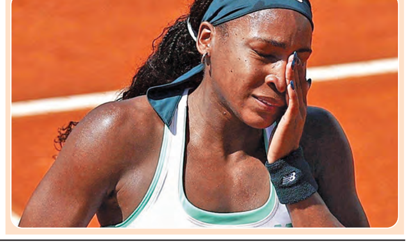
ఫెంచ్ ఓపెన్లో సంచలనాల పర్వం

పారిస్: ఫ్రెంచ్ ఓపెన్లో సంచలన ఫలితాలు కొనసాగుతున్నాయి. డిఫెండ్లో ఛాంపియన్ కోకా గాఫ్, నాలుగు సార్లు ఛాంపియన్ ఖా స్వియాటెక్ ఓటమిలతో టోర్నీ నుంచి నిష్క్రమించారు. మరోవైపు ప్రపంచ నంబర్ వన్ సబరినా, మాజీ ప్రపంచ నంబర్ వన్ నయోమి హెస్కా విజయా లతో దూసుకెళ్లారు. ఫ్రెంచ్ ఓపెన్లో పోరుకు సిద్ధమయ్యారు. లోలాండే స్టార్ ఖా స్వియాటెక్ నాలుగో రౌండ్లో అనూహ్య ఓటమి ఎదురైంది. డిక్రెయిన్కు చెందిన 15వ సిడ్ మార్కా కోస్టెక్ అద్భుత ఆటతీరుతో 7-5, 6-1 తేడాతో స్వియాటెక్ను ఓడించి తొలిసారి ఫ్రెంచ్ ఓపెన్ క్వార్టర్ ఫైనల్లోకి దూసుకెళ్లింది. క్షే క్రోస్టెక్ అధిక్యం చాటే స్వియాటెక్ ఆరంభంలో అధిక్యం కనబరిచినా.. కీలక సమయంలో వరుస డబుల్ ఫోర్లు, అనవసర తప్పిదాలతో భారీ మూల్యం చెల్లించుకుంది. అవకాశాన్ని అందిపుచ్చుకున్న కోస్టెక్ గ్రౌండ్స్ట్రాక్తో ఓడించి పెంచింది. తొలి సెట్ను 7-5తో గెలుచుకున్న డిక్రెయిన్ స్టార్.. రెండో సెట్లో మరంత దూకుడు ప్రదర్శించి అలవోకా ముగించింది. ఇక డిఫెండ్లో ఛాంపియన్ కోకా గాఫ్కు అనస్థానాన్ని పోల్పోవా పాకి ప్లింది. 4-6, 7-6, 6-4తో గెలుపొందింది. తొలి సెట్ నెగ్గిన కోకా గాఫ్.. రెండో సెట్లోనూ అధిక్యం కనబరిచింది. ఓ దశలో మ్యాచ్ పాయింట్లపై కాచుకున్న గాఫ్.. తర్వాత లయ కోల్పోయి వరుసగా రెండో సెట్లో పాటు మూడో సెట్ కూడా చేజార్చుకుంది. మ్యాచ్ అనంతరం గాఫ్ నిరాశ వ్యక్తం చేసింది. కోర్టులో తన అత్యుత్తమ ఆటను కనబరపలేకపోయానని అంగీకరించింది.