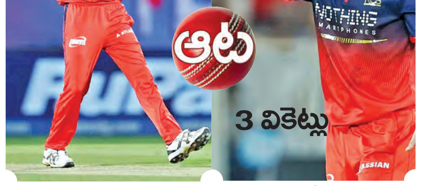
గుజరాత్ పై మరోసారి గర్జించిన ఆర్నీబీ పేస్ త్రయం

టాన్ నెగ్గిన రాయల్ ఛాలెంజర్స్ బెంగళూర్ కెప్టెన్ రజత్ పాటిదార్ బౌలింగ్ చేయాలని నిర్ణయించాడు. అవ్వడాబాద్లోని నరేంద్రమోడి స్టేడియంలో పిచ్ మొదటగా గుజరాత్ టైటాన్స్కు బ్యాటింగ్ అప్పగించాడు. ఈ మ్యాచ్ కోసం ఎలాంటి మార్పులు లేకుండానే ఆర్నీబీ బరిలోకి దిగింది. వెంకటేష్ అయ్యర్ను ఇంఫాక్స్ స్టేడియంగా కొనసాగించింది. ఇక గుజరాత్ టైటాన్స్ ఒక మార్పుతో బరిలోకి దిగింది. సాయి కింగ్ స్థానంలో అర్దేద్ ఖాన్ను తుది జట్టులోకి తీసుకుంది.