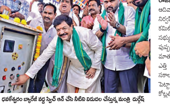
అధికారి ధవళేశ్వరం బ్యారేజ్ వద్ద స్విచ్ ఆన్ చేసి సాగునీరు విడుదల చేస్తున్న మంత్రి దుర్గేష్

ధవళేశ్వరం బ్యారేజ్ వద్ద స్విచాన్ చేసిన మంత్రి దుర్గేష్ పొల్లిన్న ఉమ్మడి గోదావరి జిల్లా ఎంపీలు, ఎమ్మెల్యేలు